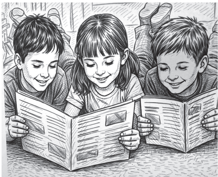
Едуковати младе о значају штампаних медија