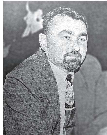
Autor iz vremena izdavanja knjige

Porodična istorija često opstaje samo u sećanjima, pričama koje se prenose s kolena na koleno i vremenom blede ili nestaju. U sredinama gde pisani tragovi nisu sačuvani, potreba da se zabeleže koreni i identitet jednog bratstva postaje čin lične i kolektivne odgovornosti. Upravo iz takvog poriva nastala je knjiga posvećena poreklu porodice Čuković, kao svedočanstvo o ljudima, vremenima i sudbinama koje ne bi smeli prekriti zaborav.