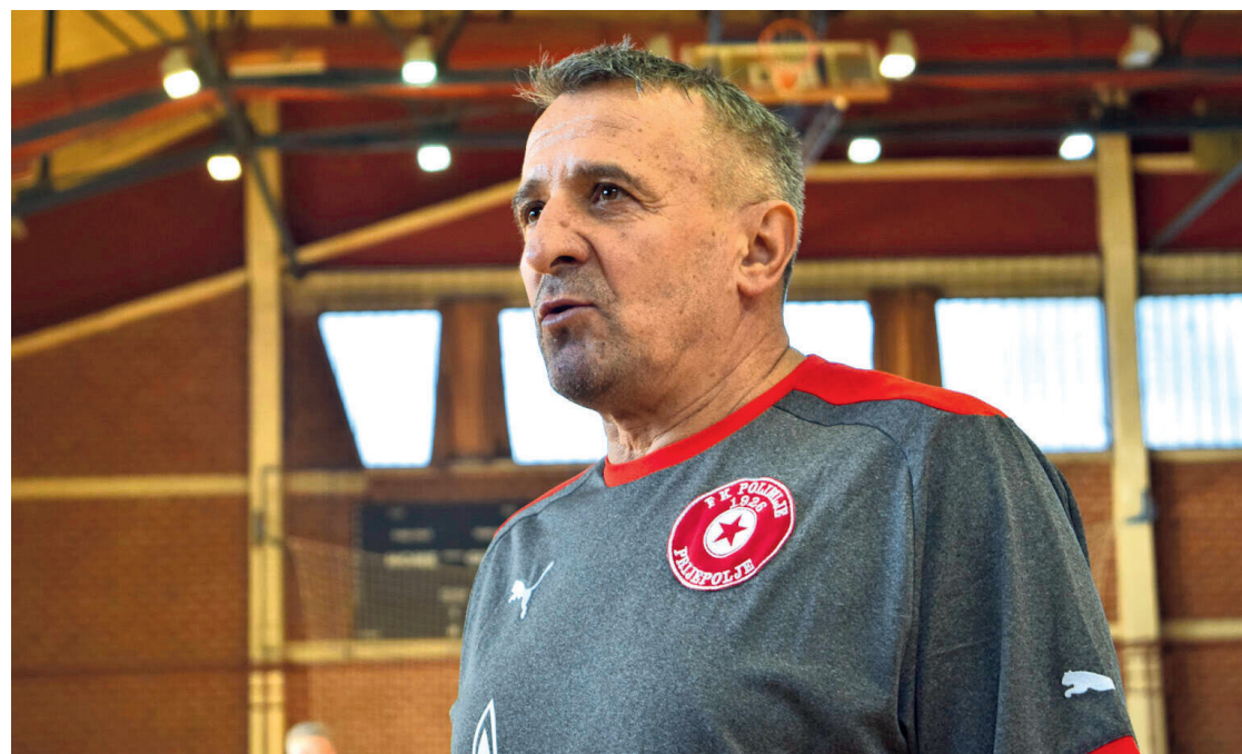
са утакмице ветерана ФК „Полимље“ (22. децембар 2024. године)

Та сезона је остала запамћена – играли смо широм Србије, многи су имали понуде, али ништа није дошло лако“.