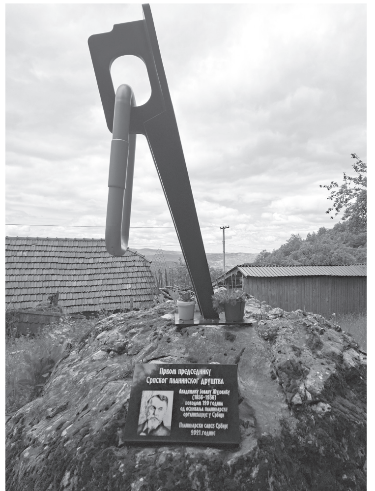
Споменик првом председнику Српског планинског друштва академику Јовану Жујовићу у Сопотници

Пријеполу очекују до краја ове календарске године још две манифестације у организацији Планинског