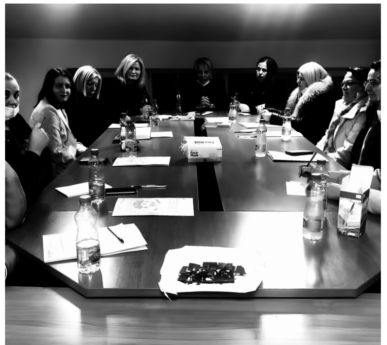
Sa održavanja okruglog stola

Iako raspolažu skromnim resursima, snaga udruženja leži u međusobnoj podršci, solidarnosti i feminističkom aktivizmu.