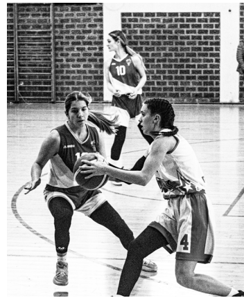
Više fotografija sa utakmice na našim mrežama