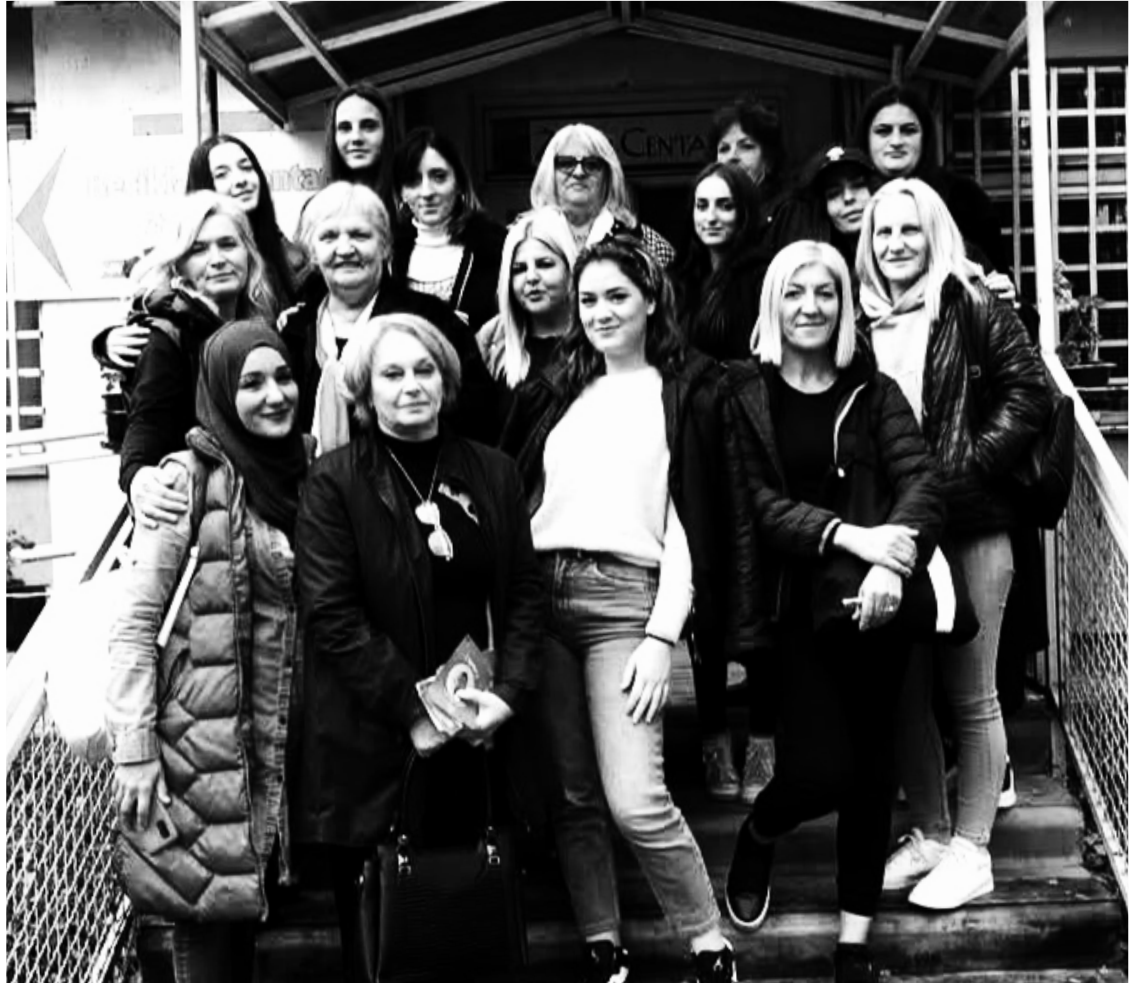
Udruženje predstavlja odraz ženske solidarnosti

Tokom zimskih meseci, kada su sela gotovo pusta, članice su obilazile seoske žene, pomagale im u svakodnevnim poslovima, donosile hranu, cepale drva