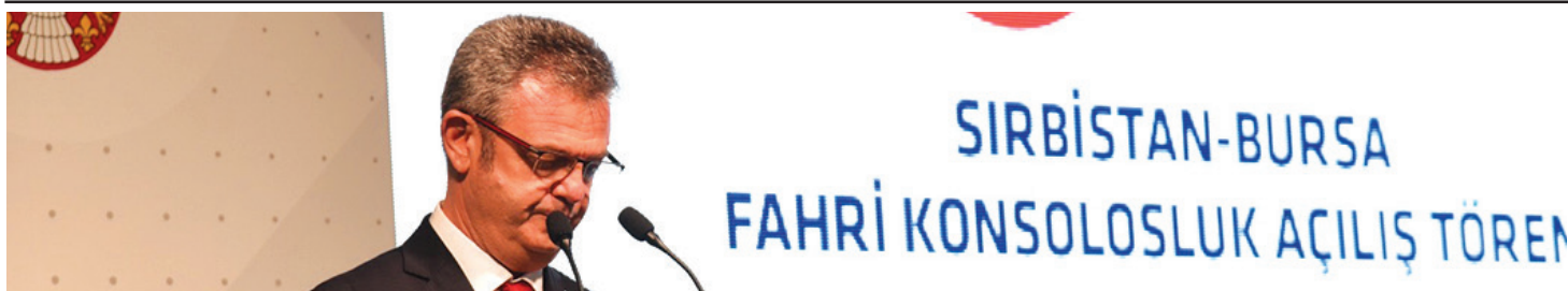
Пријеполјци ван Пријеполја Zarif Alp

ГОДИНА LXXIV | БРОЈ 3033 | ЦЕНА 70 ДИНАРА | ПРИЈЕПОЉЕ | 7. ФЕБРУАР 2025.