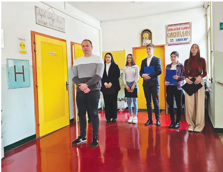
Савиндан у Економско-трговинској школи

А све школе у Србији прославиле су школску славу – Савиндан.