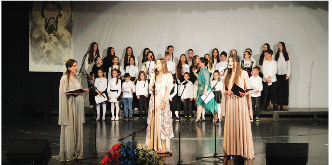
Свечана академија у Дому Културе