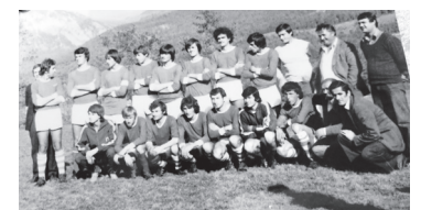
Prva ekipa Jasena