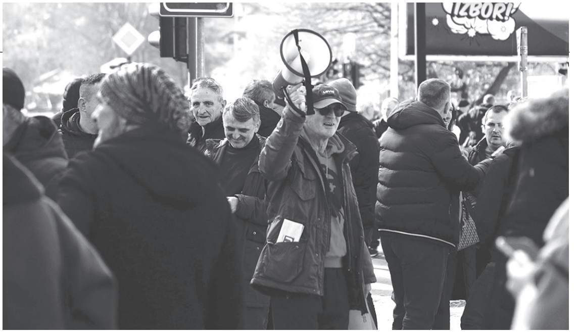
Детаљ са протеста

Шта ће нам донети ови скупови и какав ће бити даљи ток политичке мисли у Србији, питање је које се већ неко време намеће свим грађанима Србије.