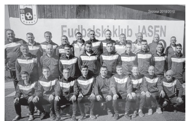
Sezona igrača 2018/2019 koja je ostvarila plasman u veći rang

OVE SEZONE U SVLAČIONICI JE JEDNA OD NAJBOLJIH U KOJIMA SAM BORAVIO, IZ TOGA CRPIMO ENERGIJU I BELEŽIMO ODLIČNE PARTIJE. KONEKCIJA CELOG TIMA SA PUBLIKOM JE ODLIČNA, NAVIJAČI NAS PRATE I NA GOSTOVANJIMA. MOGU SLOBODNO DA KAŽEM DA IM TO VRAĆAMO NA NAJBOLJI MOGUĆI NAČIN I DA OVA EKIPA IGRA NAJLEPŠI FUDBAL U NOVIJOJ ISTORIJI KLUBA.