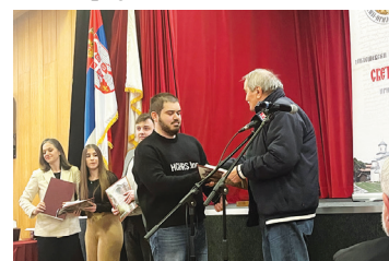
Детаљ са догађаја

Промоција је била прилика да се истакне значај културе, књижевности и историјског наслеђа, као и да се одржи континуитет у обележавању важних датума и темеља духовног и културног живота овог краја.