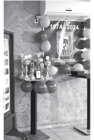
Detalj sa jubileja

FUDBALOM SE BAVIM VEĆ 17 GODINA, A U FK „JASEN“ SAM PROVEO RAČUNAJUĆI I MLAĐE KATEGORIJE 14 GODINA. KLUPSKE USPEHE I REZULTATE UVEK STAVLJAM ISPRED LIČNIH, ALI LASKA ČINJENICA DA SAM U POSLEDNJIH 7 SEZONA BIO 4 PUTA NAJBOLJI STRELAC. ATMOSFERA