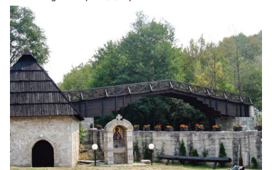
Дрвени мост, Милешева

Питање је да ли смо дорасли оваквим пројектима и инвестицијама? Да ли ћемо знати да из ценимо и