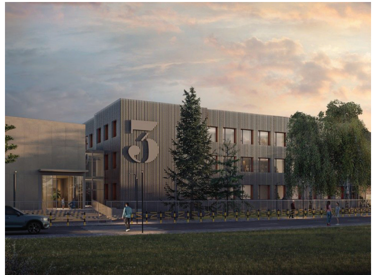
Идејно решење ОШ Владимир Перић Валтер студија A&D Architects

Да ли ће и овај пројекат имати коме да улепша детињство и унапреди квалитет живота сходно томе да нам се осипа све више становника из године у годину, остаје да време покаже. Или смо то само превише амбициозни када су у питању пројекти који треба да нама и нашој деци обезбеде бољу будућност? Министарства евидентно улажу у нашу општину, али да ли су те инвестиције будућности исплативе и да ли ће имати ко да им се радује, питање је за све.