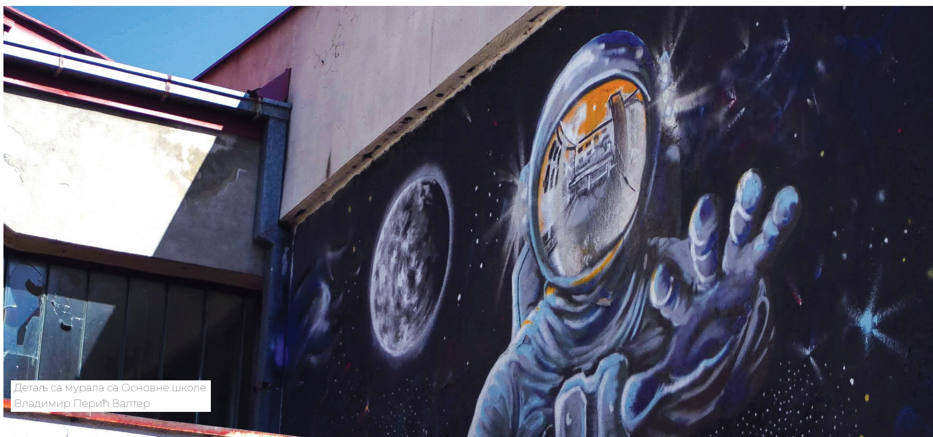
Детаљ са мурала са Основне школе Владимир Перић Валтер