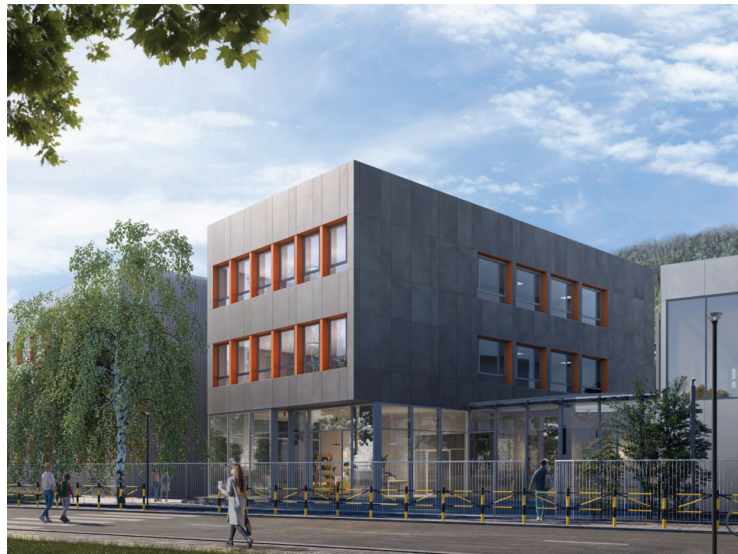
Идејно решење студија A&D Architects

Када је у питању улагање у основно образовање, три основне школе предвиђене су за реконструкцију и обнову у скорој будућности. Основна школа „Владимир Перић Валтер“ у Пријепољу доживеће реконструкцију у облику обнављања и модернизације објекта. Идејним решењем београдског Studio A&D Architects DOO Beograd, ова школа ће добити нову димензију. Пројектно решење ове фирме обухвата следеће кључне компоненте: централни објект школе, повезан са зградом за ниже разреде и новом физкултурном салом, нови објект базена, који ће бити директно повезан са школом топлим везом, спортске терене и мултифункционалну дворишну зону, прилагођену за различите спортске и рекреативне активности, дограђени вртић, који ће бити независна целина унутар комплекса. Ова школа, која по броју ученика и даље држи прво место, чека обнову и, пре свега, проширење капацитета већ дужи низ година. Такође, има и нерешен проблем са делом школе који се користи за потребе деце предшколског узраста. Према овом пројекту, требало би да добијемо не само модерну и савремену, већ и мултифункционалну школу која би била у центру града. Сходно томе да на ову реконструкцију чекамо сви већ дуже време, надамо се да ће се овај пројекат успешно реализовати. Само, да ли ћемо до краја реализације имати довољан број деце и ученика и ученица који би похађали