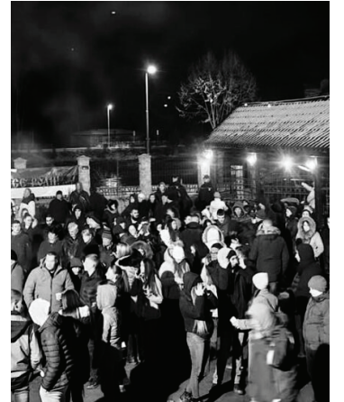
Окупљени испред цркве Светог Василија Острошког