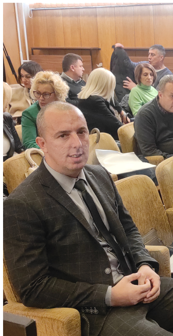
Председник општине, задовољан одлуком Скупштине о усвајању буџета