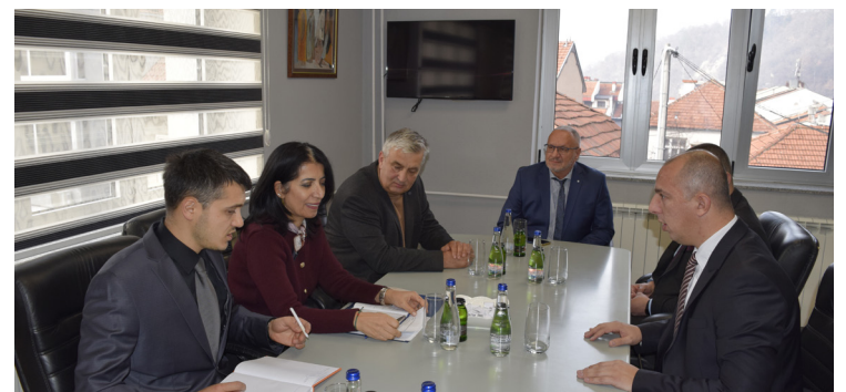
Sastanak Turske agencije za saradnju i koordinaciju (TIKA) i predstavnika opštine Prijepolje

TIKA je u Prijepolju aktivna od 2010. godine , uloživši više od milion evra u različite projekte. Najznačajniji su rekonstrukcija Doma kulture, pomoć zdravstvu i poljoprivrednicima, kao i podrška Osnovnoj školi u Vinickoj, Predškolskoj ustanovi „Miša Cvijović“ i Javnom komunalnom preduzeću „Lim“. Rekonstrukcija zdravstvene stanice u Brodarevu predstavlja nastavak uspešne saradnje, a očekuje se da će se takva saradnja nastaviti i ubuduće.