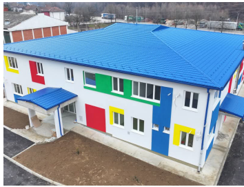
Нови вртић у Бостанима