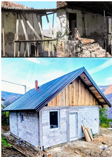
Објекат у Забрђу

Захваљујући донацијама, успели смо да обезбедимо