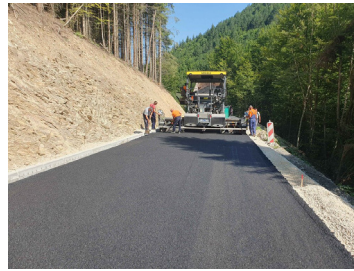
Пут за Камену Гору