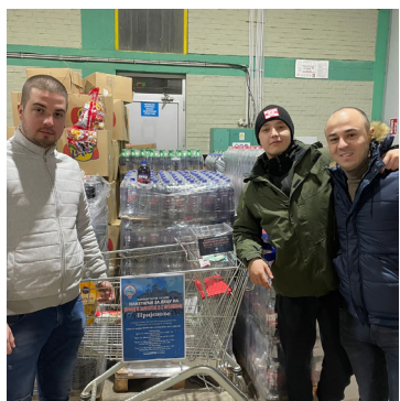
Детаљ са акције

Под окриљем Хуманитарне организације „Сви за Космет“ у Пријепољу се десету годину заредом организује традиционална хуманитарна акција прикупљања празничних пакетића. Циљ акције је да новогодишњи поклони стигну до сваког детета на Косову и Метохији, а захваљујући подршци градова широм Србије и дијаспоре, овај циљ се из године у годину успешно остварује.