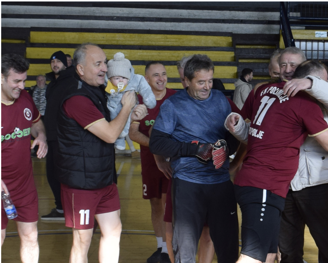
Детаљ са сусрета ветерана

„То је највећи успјех, да је клуб спашен“