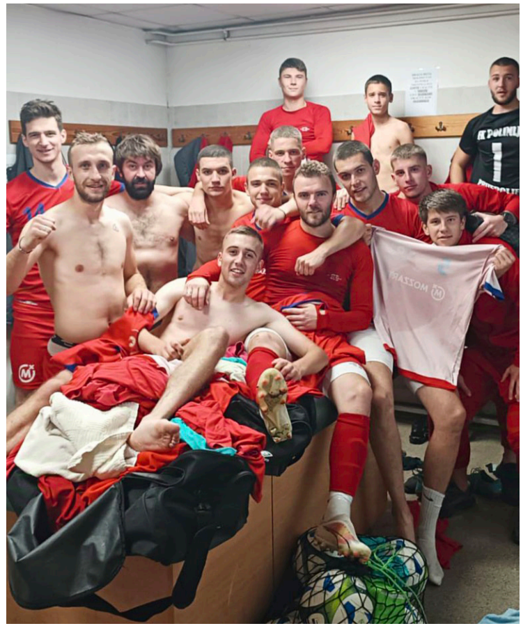
Детаљ након утакмице

ВЕРИЦА КИЈАНОВИЋ verica@listpolimlje.info