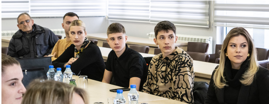
Nagrađeni učenici i studenti