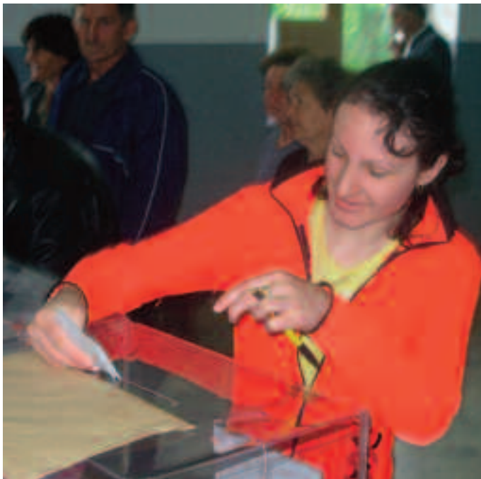
Ивање: Први глас после пунолетства

Пре пет дана окончани парламентарни и локални избори и за грађане наше општине односно за више од 35 хиљада оних који имају бирачко право, били су догађај на којем су исказали своју озбиљност у извршавању грађанске обавезе. Одлазак до бирачких места и за младе и старе била је прилика да се сретну са својим вршњацима, пријатељима, комшијама али и политичким истомишљеницима а понегде и политичким противницима. И овог пута ова мултиетничка средина показала је своју одговорност и кроз изузетно велику излазност забележену на овим изборима.