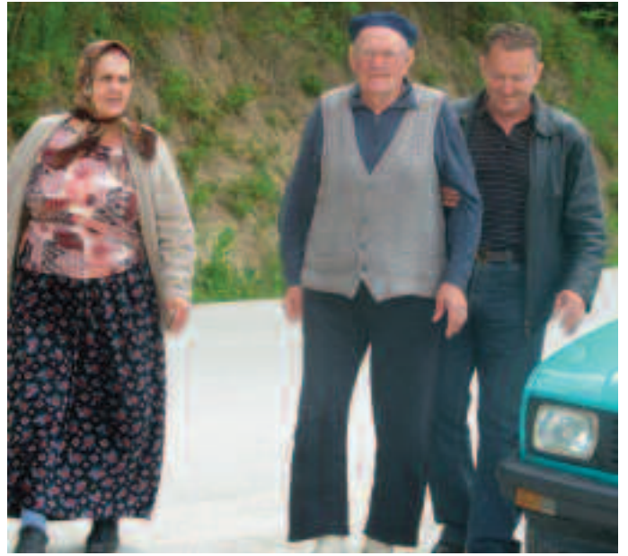
Стари до бирачких места у пратњи млађих