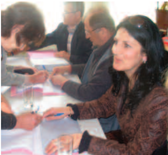
Коловрат: Осмех лепшег дела бирачког одбора