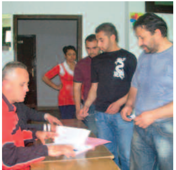
На бирачко место у групи: Припадници Рома