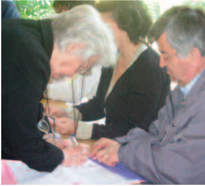
Дом културе: Одговорност бирачког одбора и гласача