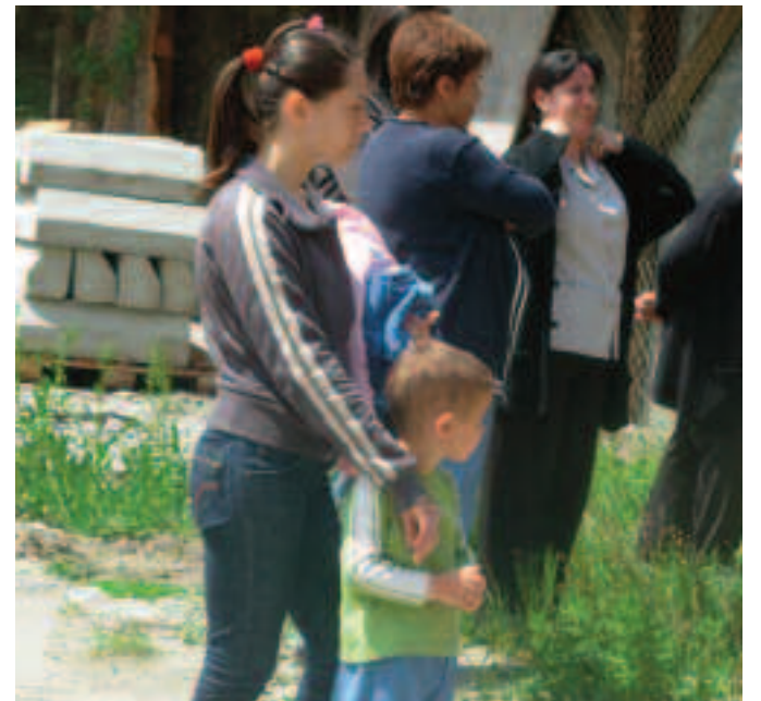
Кад ће мама завршити са грађанском обавезом